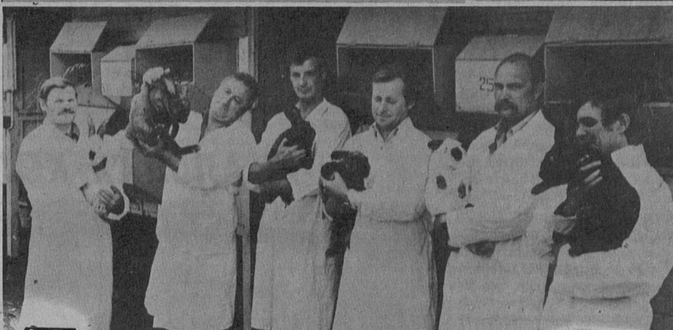
И стали электромонтажники — кролиководами

Одно из интересных начинаний акционерного общества «Сосновоборэлектромонтаж» — кролиководческая ферма. Электромонтажники, ставшие кролиководами, быстро освоили новое дело, усовершенствовали конструкцию клеток, оснастили их автопилками с подогревом. В результате кролики не болеют, хорошо плодятся. Пород пока немного — белый великан, бабочка, серебристый, Венский голубой, Калифорнийский, советский мардер.