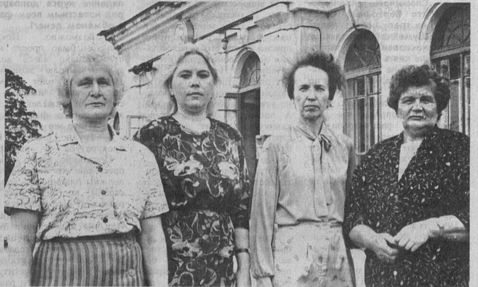
В прошлые годы летом редко какой выходной не был отмечен каким-нибудь профессиональным праздником. Вспомните, праздники имели широкий резонанс в городе среди трудовых коллективов.

В России сейчас есть официальные праздники, а вот те, отраслевые, как-то померкли, а то и вообще канули в Лету.