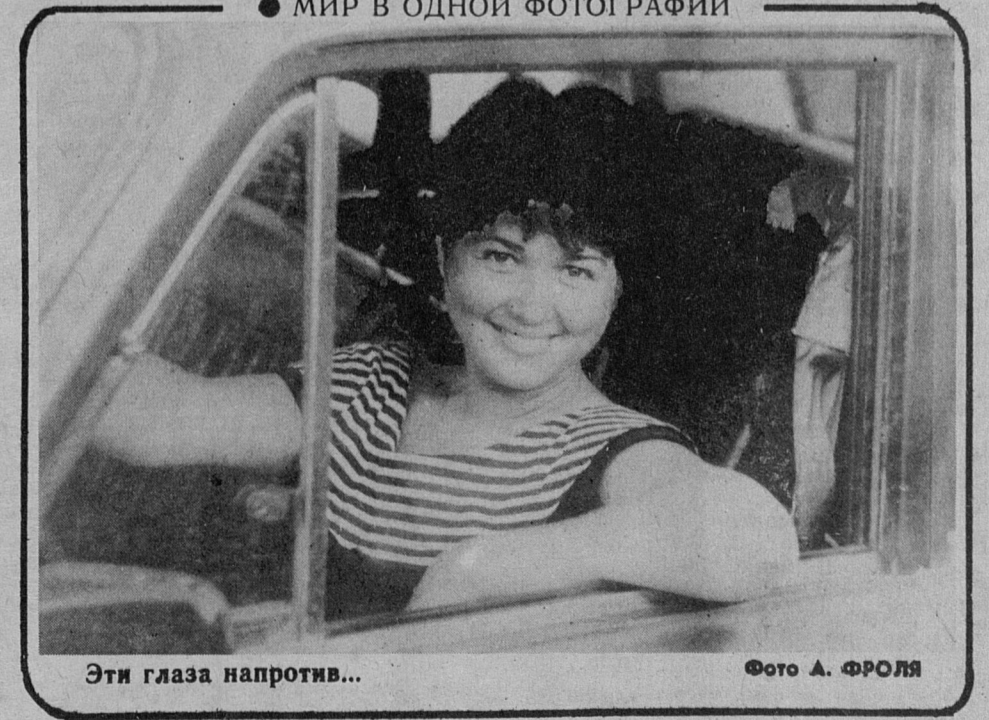
Эти глаза напротив...