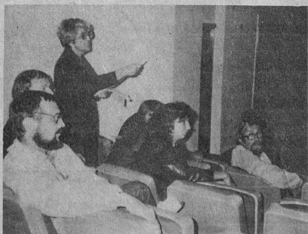
● ПРОБЛЕМЫ МИКРОРАЙОННОГО МАСШТАБА