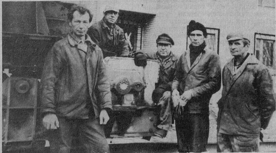
Бригаду монтажников башенных кранов управления механизации АО «СУС» наш фотокорреспондент снял на демонтаже крана около недавно построенной коробки пятиэтажного дома со строительным номером 29/7.

Закончив демонтаж крана, бригада продолжит работы на объектах по реконструкции ЛАЭС.