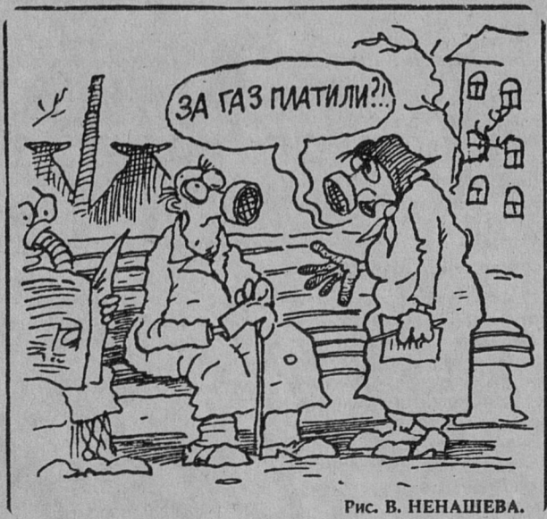
Рис. В. НЕНАШЕВА.