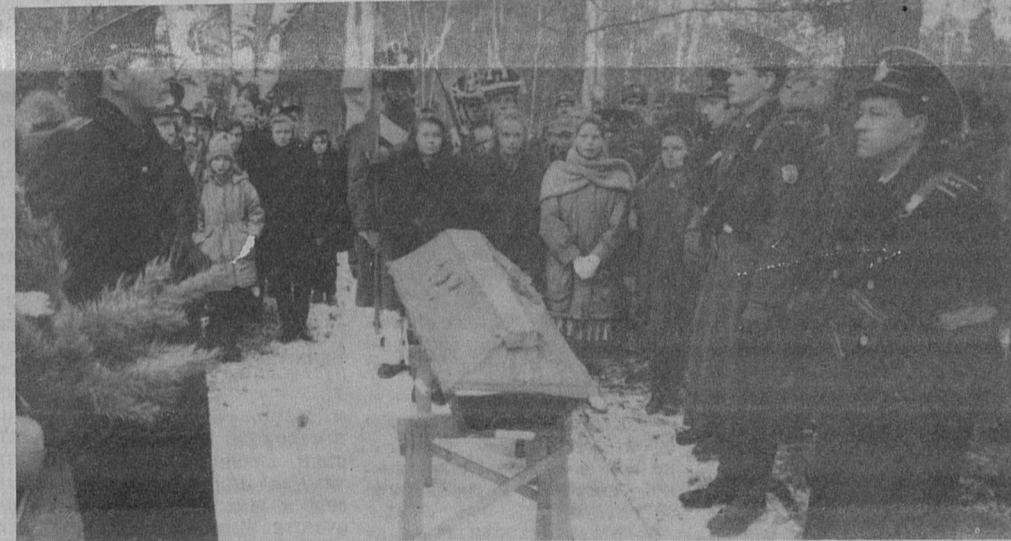
● КРИК ДУШИ

Ежегодно с наступлением отопительного сезона на улице Ленинской начинается ремонт тепловых труб в связи с авариями. Такое ощущение, что городские власти и машзавод ничего не делают в летнее время по замене труб, зная о том, что все коммуникации давно подлежат замене. В этом году уже трижды отключали отопление и горячую воду. И сидят старики без тепла и горячей воды — опять авария. На звонок в горисполком, чиновник, который от-