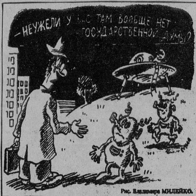
Рис. Владимира МИЛЕЙКО.

Т. ЧИСЛОВА, председатель городского совета ветеранов