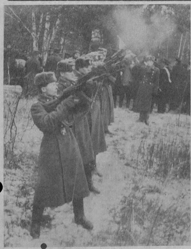
Минуло почти полвека, как закончились бои в районе реки Воронки, но до сих пор продолжают обнаруживать останки защитников, погибших в оборонительных боях. 9 ноября на территории мемориала «Берег мужественных» состоялась траурно-торжественная церемония перезахоронения останков погибших воинов. Безымянным защитникам Отечества, как и положено по воинскому уставу, были отданы церемониальные почести.