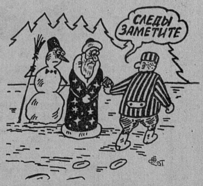
Рисунок Леонида МЕЛЬНИКА

10.40 Видеотекст городской службы занятости. 11.05 "Спиди-гонщик", мультфильм. 11.30, 18.05, 21.40 Паровоз Ти-Ви. 12.05 Программа телекомпании ТВН. 13.05 Утренняя почта. 13.35 Гиннесс-шоу. 14.10 "Европа плюс" представляет шоу с Геннадием Ветровым. 18.40 Хронограф. 19.00 Миллион алых роз. 19.10 Уроки бодибилдинга. 19.25 Трюк-машина. 19.55 Петроскоп. 20.00 Конкурс "Сыграем!". 20.10 "Девушка с рыжими волосами", х. ф. (Финляндия).