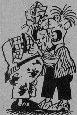
Рисунок О. ТЕСЛЕРА.

Но до суда напишите исполнителю претензию. В ней перечислите недостатки, сошлитесь на статью 30 Закона «О защите прав потребителей», в соответствии с которой вы можете потребовать по своему выбору либо безвозмездного устранения недостатков, либо соответствующего уменьшения вознаграждения за выполненную работу, либо расторжения договора с возмещением убытков. И если ваша претензия не будет удовлетворена, идите в суд.