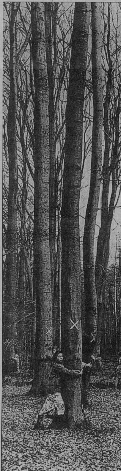
Некоторые предпочитают лечиться не у врачей, а у... деревьев.

астений, имеющих разный знак воздействия, причем место их расположения должно быть удалено по крайней мере на метр от места сна, отдыха и работы людей. Влияют и люди на растения. Французского писателя М. Дрюона есть сказка о мальчике с «зелеными пальцами». Как только этот мальчик прикасался к растению, оно начинало бурно расти. Но и без сказок многие знают, что есть люди с легкой рукой и с тяжелой. У человека с легкой рукой все им посаженное хорошо растет, а уж если рука тяжелая... Я полагаю, что это свойство привязано не столько к самим пальцам, сколько к человеку в целом. Если человек относится к растениям, как к живым существам, и общается с ними радостно, то скорее всего растения будут хорошо расти. Если такие качества являются постоянным признаком данного человека, то скорее всего у него «зеленые пальцы».