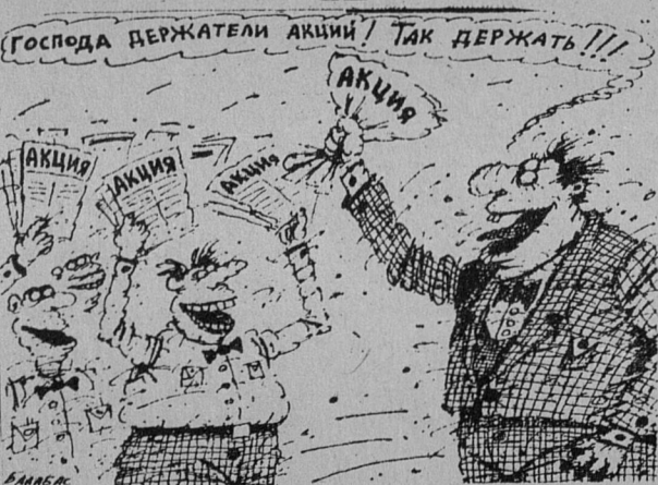
Нам рисует В. БАЛАБАС (Симферополь).

СТРАХОВАЯ КОМПАНИЯ «АСКО-ПЕТЕРБУРГ» извещает своих клиентов о том, что с 15 июля 1994 года величина накопительного процента по Договорам индивидуального смешанного накопительного (бонусного) страхования жизни устанавливается в размере 60 процентов годовых.