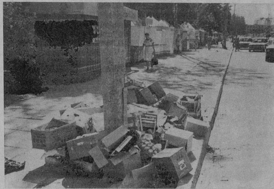
ФИРМА «ИНГРИЯ СТАР»

играть детям. Дворовые детские комплексы терпят бедствие, Копорская крепость уже все перетерпела и больше ничего не терпит, включая и посети-