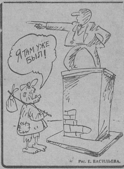
Рис. Е. ВАСИЛЬЕВА.

С другой стороны, начинаешь еще более остро осознавать, какой пример могла бы являть собой Россия с ее величайшими ресурсами и возможностями, получи она правильное развитие, сумей вырваться из тисков рабства, оказавшаяся в нем еще и по причине своей излишней доверчивости к словоблудию подлецов и их несбыточным посулам. Красная фразеология уходит, но что входит в моду? Коричневая. Неужели осознав, что не боги горшки обжигают, мы будем не терпеливо и спокойно учиться этому, а продолжать в безумной ярости крушить их, оставляя после себя одни черепки?