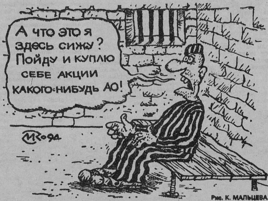
Рис. К. МАЛЫШЕВА.