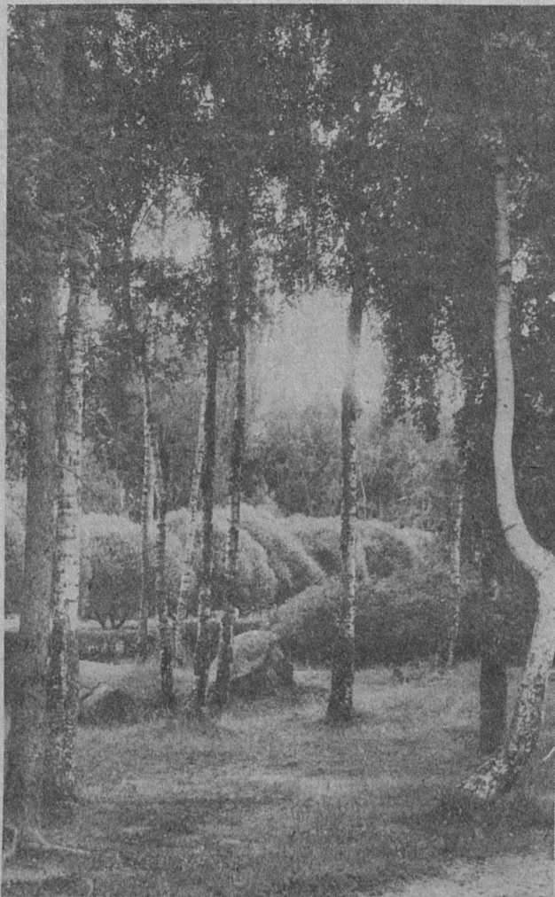
● ГОРОДСКОЙ РАКУРС