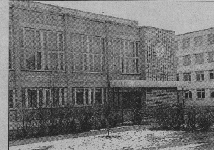
На снимке: комплекс СПТУ-236.