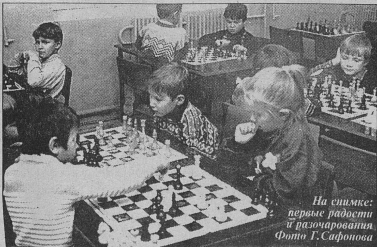
На снимке: первые радости и разочарования.