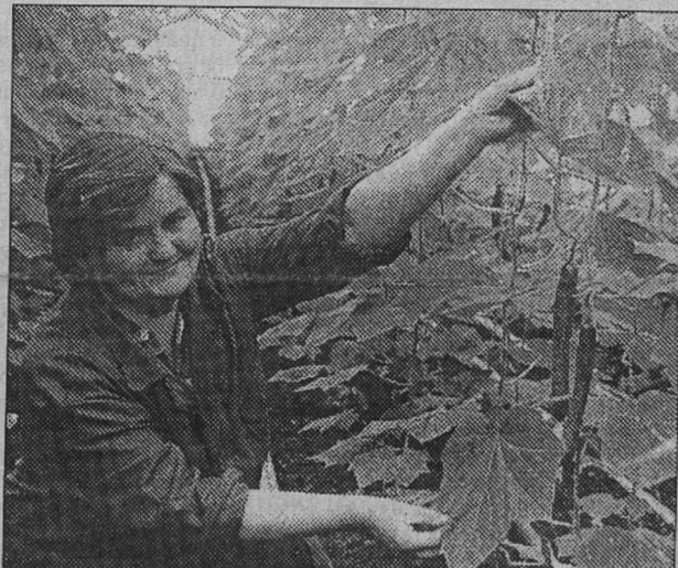
Текст и фото Геннадия Сафонова