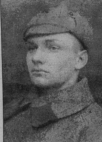
На снимке: автор публикации 1940 год.