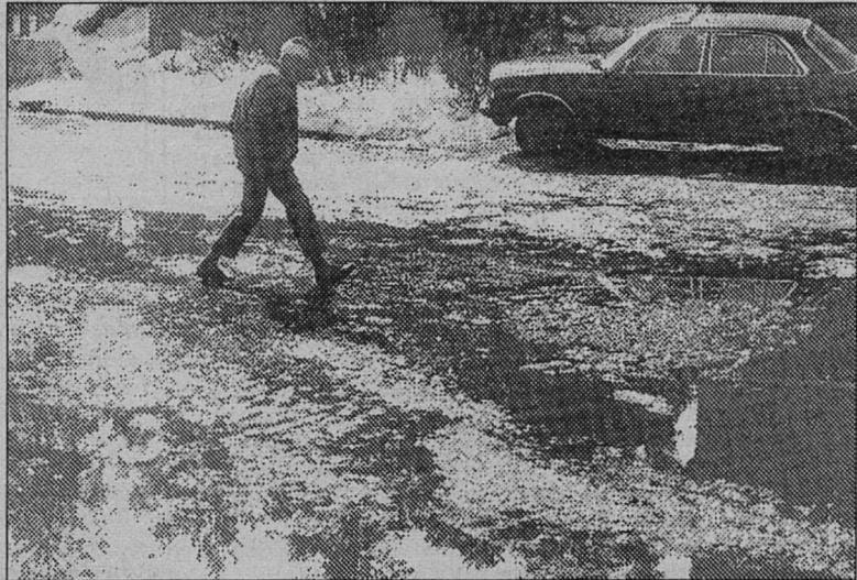
+ С фотоаппаратом по городу

Не храните дома 130 меховых шапок! 21 марта в период с 20 до 23 часов 30 минут, неустановленные преступники, отжав входную дверь в одной из квартир дома N 34 по про-