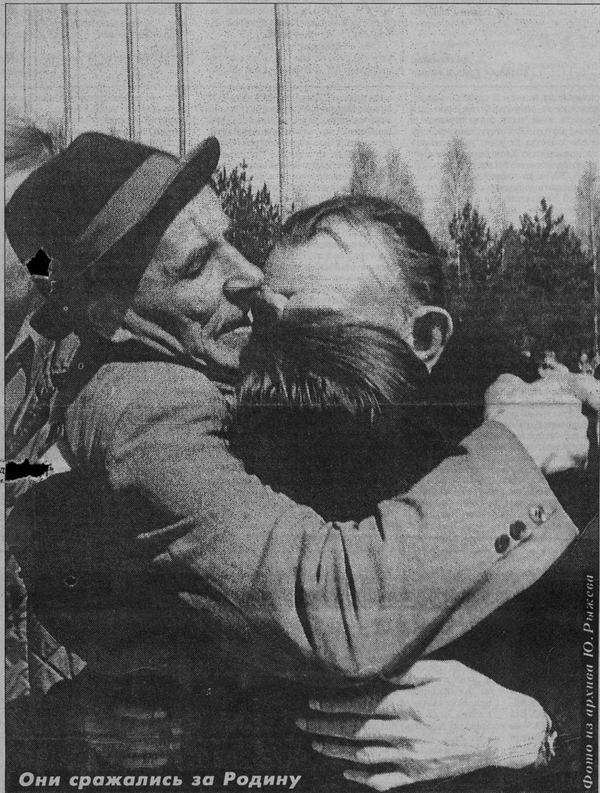
Они сражались за Родину

ВОТ УЖЕ 51 ГОД ДЛЯ ГРАЖДАН НАШЕЙ СТРАНЫ ЭТИ СЛОВА СОСТАВЛЯЮТ НЕРАЗРЫВНОЕ ЦЕЛОЕ