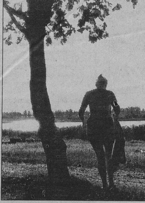
«КУПАНИЕ НА ЗАКАТЕ»