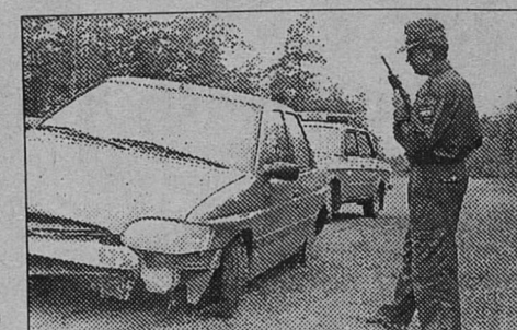
В салоне следов крови не было видно. На переднем сидении лежали покоренные остатки снятого с машины бампера. Правые колеса падали от удара.

сотрудникам дорожно-патрульной службы предстоит сопровождать негабаритный транспорт. А еще они отправятся во Всеволожск за билетами для голосования. - Николай Павлович, город растет. Увеличивается зона обслуживания. - ГАИ в Сосновом Бору была образована в 72 году. Через пять лет ее существования в него спецники работало всего девять человек. Сейчас двадцать пять. Если верить во внимание существующих норм, то в штате должно быть около пятидесяти сотрудников. Но мы пока справляемся. Заметим, что наши ГАИшники на фоне коллег из других городов - согласно статистике - выглядят достойно. Об этом говорит и то, что