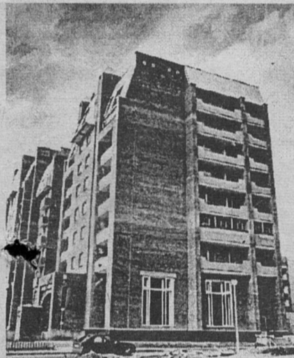
СООБЩАЕТ УПРАВЛЕНИЕ ПО ДЕЛАМ ГО И ЧС ГОРОДА

Как долго они его ждали - всю жизнь. Большинство из тех, кто въезжает в эти дни в красивый, 9-этажный кирпичный дом № 32 по ул. Ленинградской, скованы одной цепью, одним прошлым - под названием очередь. В ней отмучили свое наши бюджетники, попавшие в списки очередников в начале 80-х.