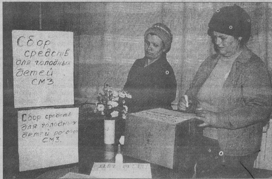
На снимке: активистки женсовета заканчивают последние приготовления к проведению акции милосердия.

Пикеты по сбору средств будут выставлены сегодня, 1 февраля, и завтра, 2 февраля у ресторана "Дюны", магазинов "Сосновый Бор", "Таллин", "Ленинград", торговых центров в 10а, 10б и 4 микрорайонах с 11 до 15 часов. Принимаются консервированные продукты и денежные пожертвования.