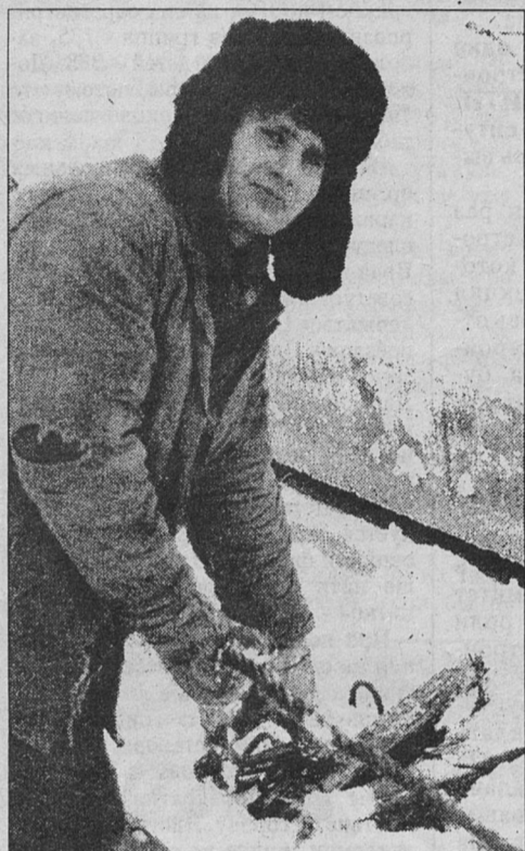
Затишье на строительстве детской поликлиники, похоже, кончилось. Оно началось в середине июня прошлого года, когда забытые специалистами управ-