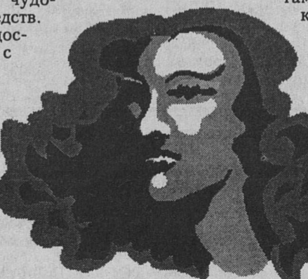
Отдел защиты прав потребителей