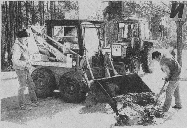
С 23 апреля, в соответствии с постановлением мэра, в Сосновом Бору начался декадник по уборке города.

Все предприятия и организации, независимо от форм собственности, личный состав воинских частей, учебные заведения должны были навести "марафет" на закрепленных территориях.