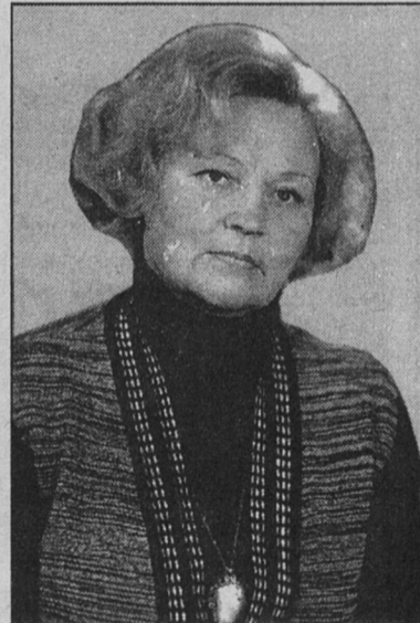
Фото из семейного альбома: когда мы были молодые...

Кстати, о шиповнике. Вы задумывались когда-нибудь, почему этого кустарника так много на наших улицах, но совсем нет на территории детских садов? Секрет прост: чтобы дети не укололись шипами. Об этом, когда не было ни этих детских садов, ни их будущих воспитанников,