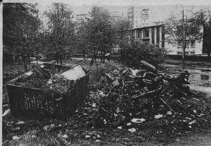
СВАЛКА НА КОМСОМОЛЬСКОЙ РЯДОМ С ГОРВОЕНКОМАТОМ