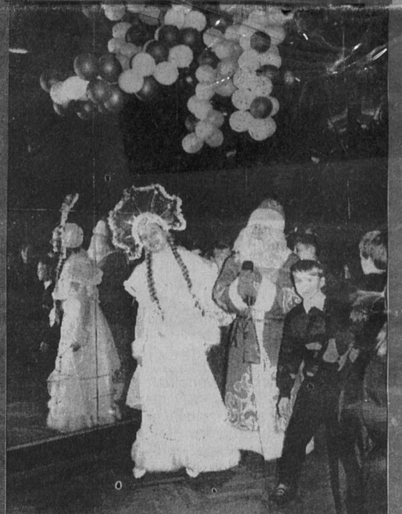
2 января. Театрализованное представление "Как-то раз под Новый год..." в городском Доме культуры.