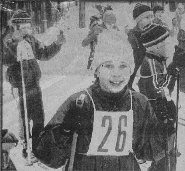
31 декабря. Последние соревнования 1996 года - городской лыжный кросс.