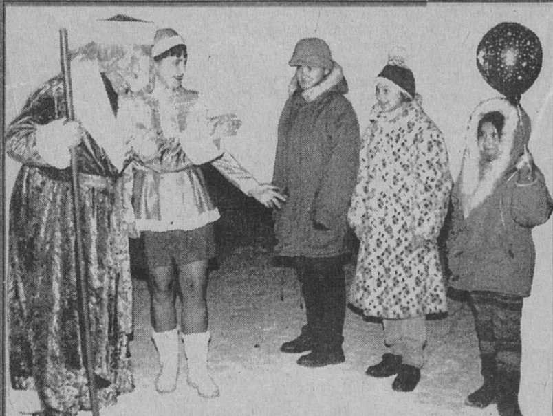
Артисты народного театра "КриМ" клуба ЛАЭС в праздничные дни вышли на улицы города. И получился не просто КриМ, а почти ice-КриМ.