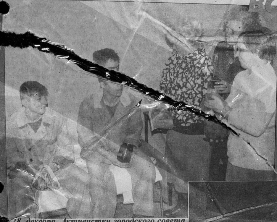
28 декабря. Активистки городского совета женщин вручают подарки пограничникам, проходящим курс лечения в госпитале.