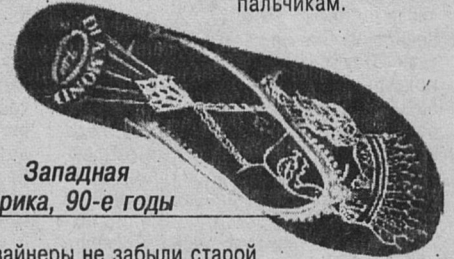
Западная Африка, 90-е годы

Западный современный вариант индийской сандалии (см. выше). Прозрачная обхватывающая ногу перемычка создает эффект необычной открытости ступни, а элегантный шарик притягивает все внимание к нежным пальчикам.