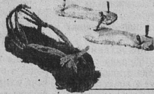
Северная Америка Египет, 2500 лет до нашей эры

Изящная, полностью открытая туфелька как ничто иное дает вам возможность показать свою эротичность и соблазнительность вплоть до пальчиков ноги.