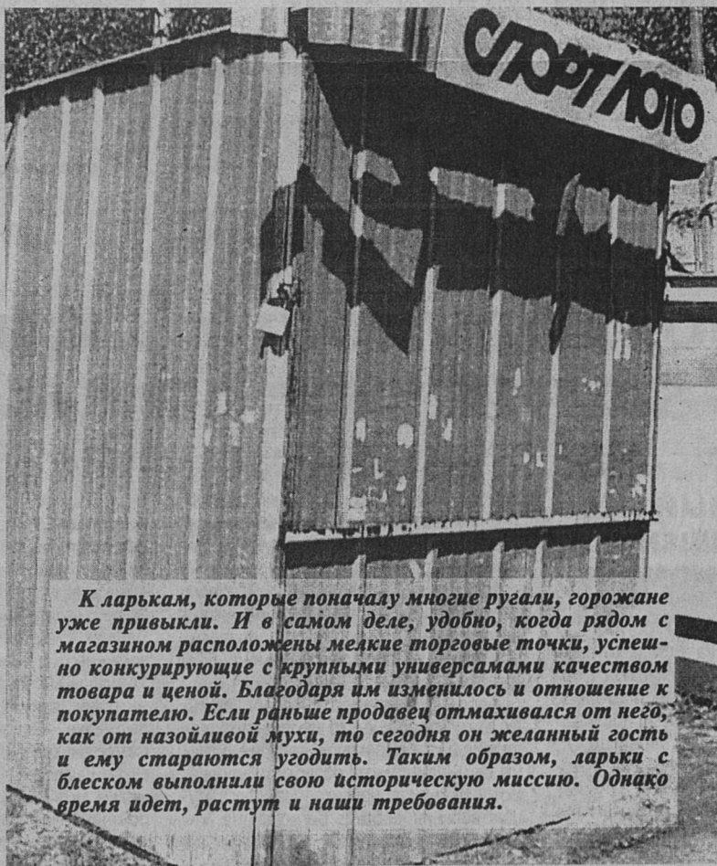
К ларькам, которые поначалу многие ругали, горожане уже привыкли. И в самом деле, удобно, когда рядом с магазином расположены мелкие торговые точки, успешно конкурирующие с крупными универсамами качеством товара и ценой. Благодаря им изменилось и отношение к покупателю. Если раньше продавец отмахивался от него, как от назойливой мухи, то сегодня он желанный гость и ему стараются угодить. Таким образом, ларьки с блеском выполнили свою историческую миссию. Однако время идет, растут и наши требования.

дики» и других магазинов также появятся новые торговые городки.