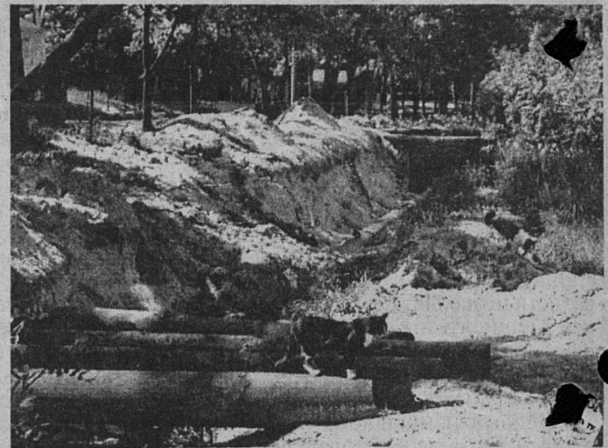
На снимке: продолжается ремонт теплотрассы на улице Комсомольской.

- Две семьи по решению суда действительно выселены из своих квартир в дома без удобств деревни Старое Калище. Свое прежнее жилье они потеряли навсегда. Сейчас подготовлены списки на 100 должников, которые не платят и нам, и Горэлектросети. Будем отключать для начала их квартиры от электричества. А самыми добросовестными по-прежнему являются наименее обеспеченные в нашем обществе - пенсионеры. Хочу сказать, что оплатить в кассе ЖЭКа можно практически любую сумму, и касса ее к оплате обязана принять. Кроме того, если должник представит в виде заявления график погашения задолженности и начнет вносить плату, к нему не будут применены никакие санкции.