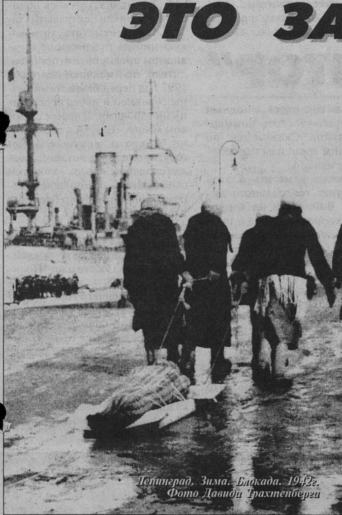
Ленинград. Зима. Блокада. 1942г.

Защитники Ораниенбаумского плацдарма вместе с воинами Ленинградского фронта с честью выполняли свой долг перед Родиной, защищая Ленинград от фашистских захватчиков. 900 долгих дней и ночей длилась блокада.