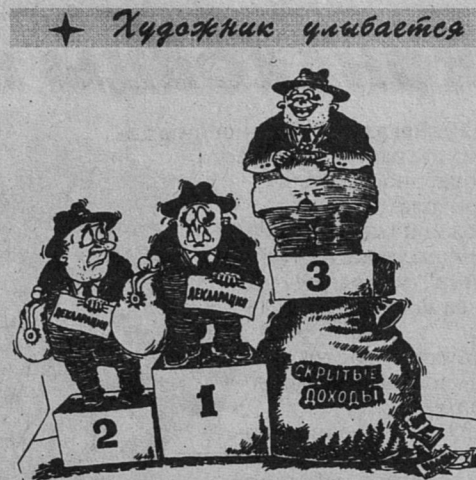
★ Художник улыбается

Занимаются этой проблемой и наши ученые из Института земного магнетизма, ионосферы и распространения радиоволн. Познакомившись с данными «Скорой помощи», они заметили: в рабочие дни число инфарктов миокарда примерно одинаково, а вот в выходные оно резко снижается. Анализ привел к выводу - дело во влиянии электромагнитных полей. В выходные дни не работает большинство промышленных предприятий. Удалось обнаружить, что в будние дни уровень искусственного электромагнитного «шума» в городе в 10-100 раз выше, чем за городом.