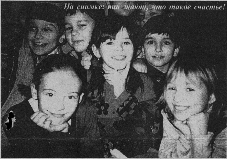
На снимке: они знают, что такое счастье!

Редакция благодарит учителя начальных классов гимназии N5 Г.М.Лалетину за любезно оказанную помощь в подготовке этого материала.