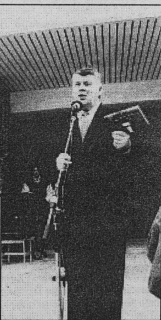
Фотомонтаж: спортивно-концертный комплекс отныне и навсегда будет служить нам, сосновоборцам.