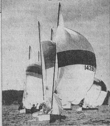
Государственная инспекция по маломерным судам в соответствии с действующим законодательством

Контроль за соблюдением правил пограничного режима на территории Ленинградской области возлагается на органы внутренних дел, войска Северо-Западного пограничного округа и Ленинградскую областную государственную инспекцию по маломерным судам. Владельцы судов, не прошедшие регистрацию или ежегодное техническое освидетельствование, являются нарушителями пограничного режима и могут быть подвергнуты штрафу в размере: физические лица - до 10, юридические - до 50 МРОТ.