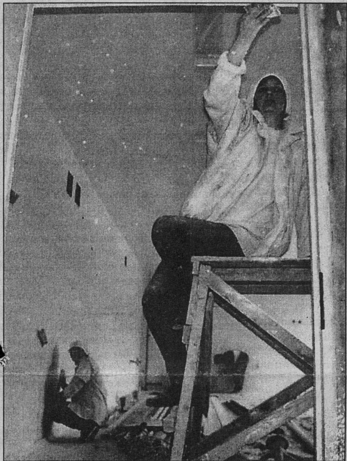
На снимке: школа №9 - идет отделка слесарных мастерских Читайте материал на 2-ой стр.