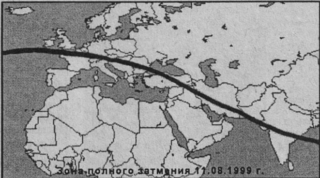
Зона полного затмения 11.08.1999 г.

Сошедший с горящего неба - теперь повелитель земли. Конец и начало столетья мятежным живут человеком, Открытие Марса свободу грозит. (Москва, издательство «Манускрипт», 1991 год.)