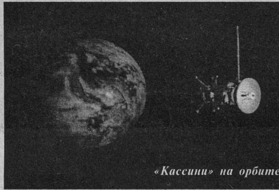
«Кассини» на орбите

Говоря о благоприятных толкованиях, оптимистам