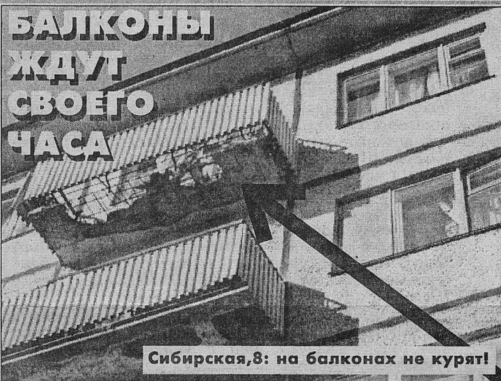
Сибирская, 8: на балконах не курят!

Упавшим балконом теперь не удивишь никого. В Сосновом Бору, слава Богу, к такому пока не привыкли - тьфу, тьфу, поводов не было. А в Москве, Петербурге и прочих городах со стареющим жилфондом, случаи полетов, причем неоднократные, зарегистрированы были. В том числе - с трагическими исходами. Мы тоже теперь не настолько молоды, чтобы не думать о таких вещах. Тем более, когда основания для беспокойства имеются. Известна и дислокация этих поводов для волнений: расположены они во всех четных домах с № 6 по 16 по улице Сибирской.