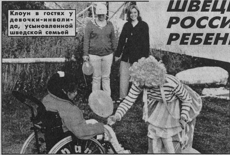
Клоун в гостях у девочки-инвалида, усыновленной шведской семьей