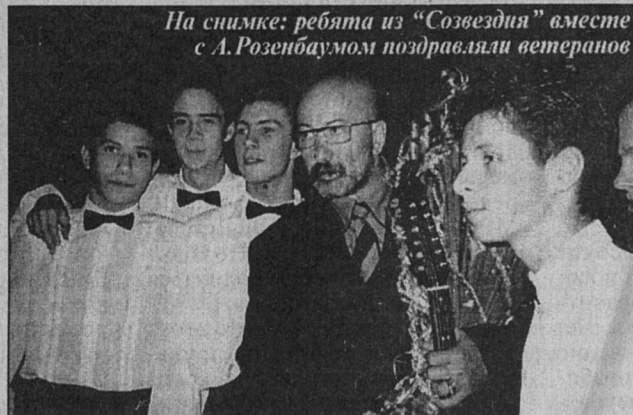
На снимке: ребята из «Созвездия» вместе с А.Розенбаумом поздравляли ветеранов