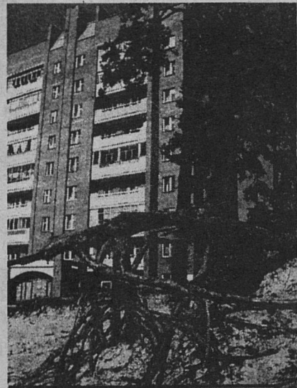
Корни накренившейся сосны давно приняли угрожающий вид. В ПО ЖКХ этого упорно не хотят замечать.

Мы решили, что нельзя забывать уроков прошлого и прошлись с фотоаппаратом по городу.