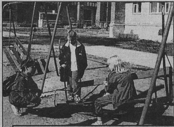
Во дворе дома №62 по ул. Ленинградской очередное катание на качелях для кого-то может стать печальным.

Раньше, во времена «народного контроля», газеты принимали активнейшее участие в рейдах общественных бичевателей. По нарушителям порядка, бесхозяйственности наносился решительный удар посредством газетной строки и, что самое важное - фотофактов. Фоторейды, кстати, приносили порой немалую пользу в борьбе за правое дело жителей, желающих иметь устроенный быт и отлаженное городское хозяйство.