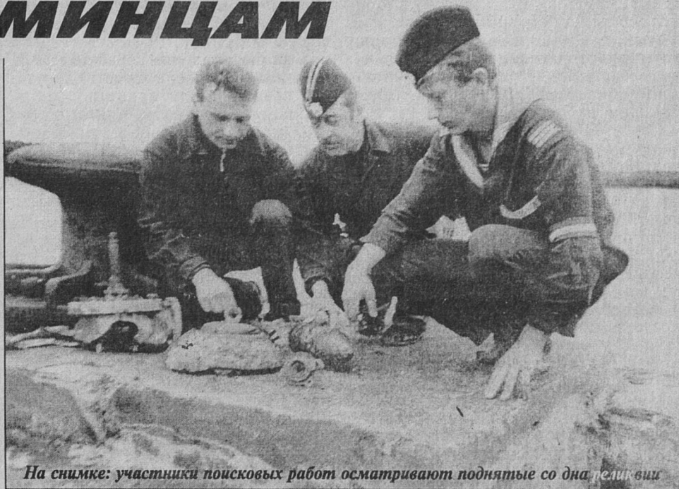
На снимке: участники поисковых работ осматривают поднятые со дна реликвии

ботягами. Потому и заварилась революционная каша. Чего тут переименовывать?