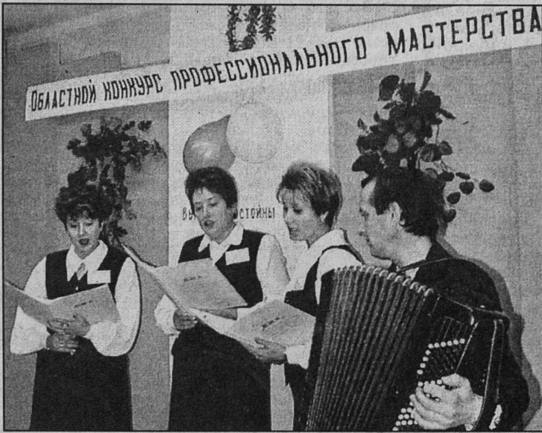
районное управление почтовой связи, называемое «Ломоносов-

Очередной из них - среди отделений связи - состоялся в минувший вторник. Сейчас в области 17 районных управлений почтовой связи. Девять лучших (Бокситогорский, Выборгский, Гатчинский, Киришский, Кировский, Лодёно-польский, Ломоносовский, Подпорожский и Тосненский) прислали своих представителей в Сосновый Бор. Напомним, что после включения Ломоносова в городскую черту Санкт-Петербурга, именно в нашем городе располагается