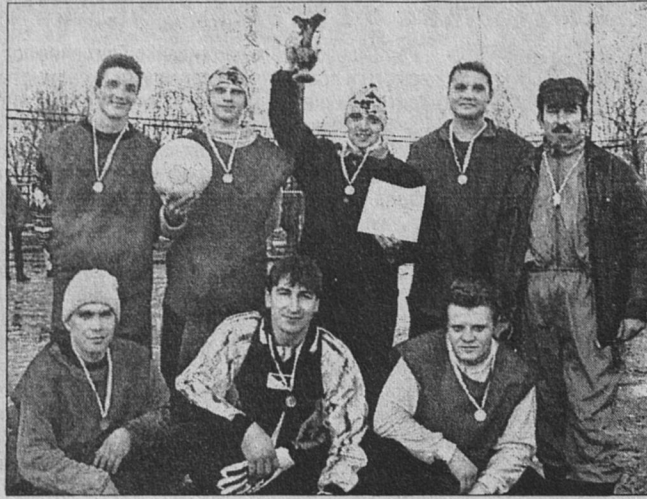
сто - команда «Надежда» клуба «Мечта» (тренер А.М. Дыхно).

В первой группе (подростки до 13-ти лет) сильнейшими стали игроки клуба «Копорец» из Копорья (тренер А.В. Крутиков). Вторым призёром - команда «Каскад-2» (тренер В.П. Паракуда). Третье ме-