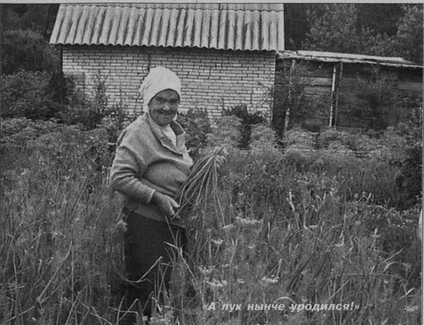
«А лук нынче уродился!»