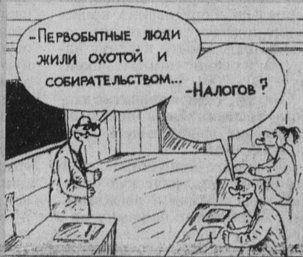
Рис. А. ЕВТУШЕНКО (г. Ростов-на-Дону).

Думается, эта информация привлечет ваше внимание, уважаемые читатели, ибо у каждого из нас есть имущество.