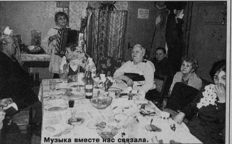
Музыка вместе нас связала.