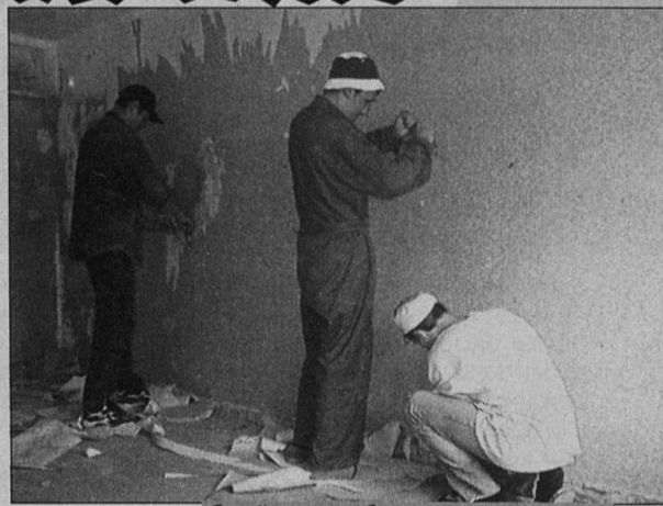
Свой дом обустроиваем сами