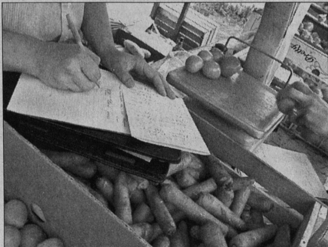
Можно составлять протокол.