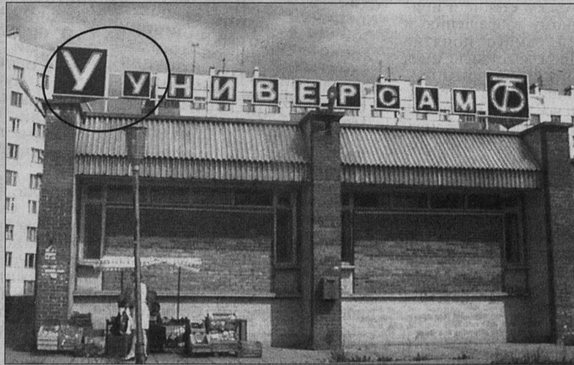
У-у, как много еще предстоит сделать...

глава муниципального образования, мэр г. Сосновый Бор