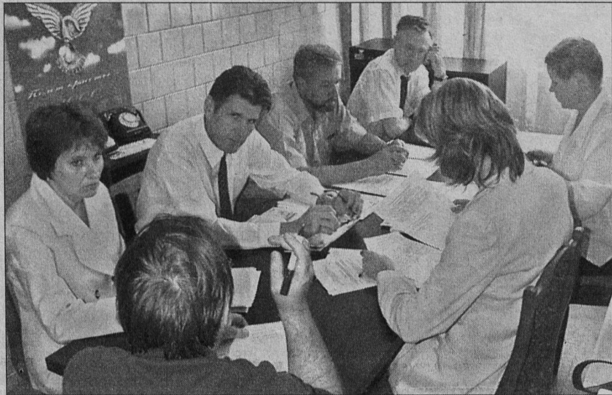
Заседание конкурсной комиссии близится к завершению.

P.S. Интервью с директором фирмы, ставшей победителем в торгах, читайте в следующем номере.