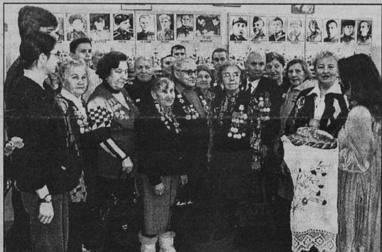
Утром 27 января учащиеся и педагоги школы №2 хлебом-солью встретили ветеранов 5-й отдельной бригады морской пехоты и других частей, защищавших Ораниенбаумский плацдарм.