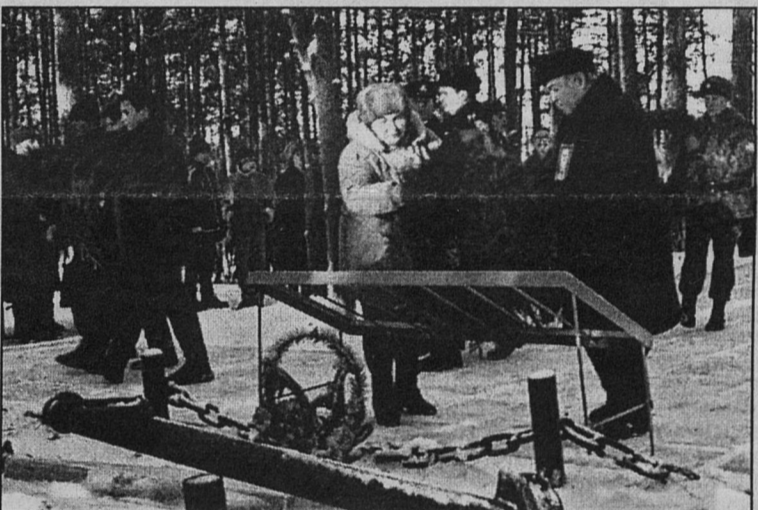
27 января. Мемориал в Устье. Венки и цветы павшим за Ленинград.

Как известно, в феврале произойдёт повышение пенсии на 20%. Исполняющий обязанности президента подписал также Указ №89 от 21 января «О повышении размера компенсационной выплаты малообеспеченным категориям пенсионеров».