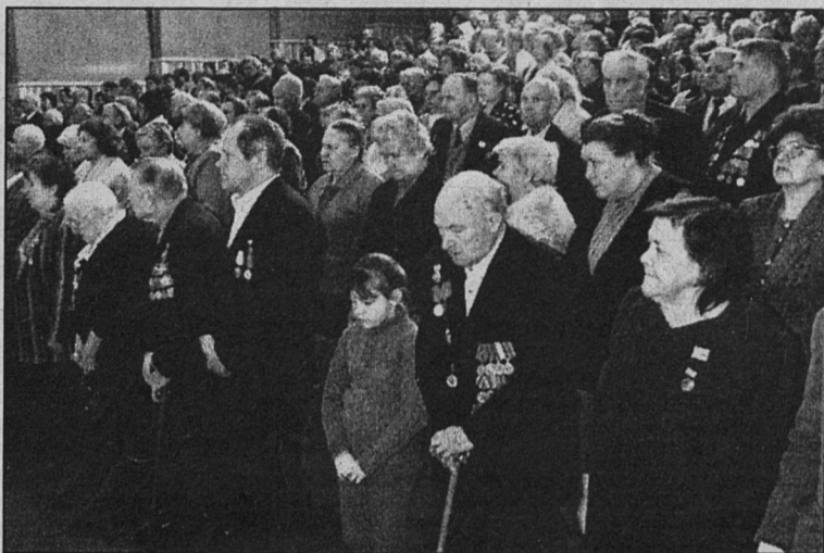
26 января. ДК «Строитель». Минутой молчания участники городского собрания, посвящённого 56-й годовщине полного снятия блокады Ленинграда, почтили память павших в битве за город на Неве и тех, кто ушёл от нас в послевоенные годы.